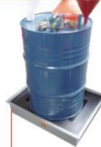
170x650x650mm Pallet 1 tambor Baixo perfil Polietileno Cód. TK14101 Aço Cód. TK14103