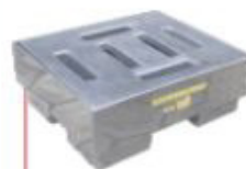
300x650x650mm Pallet 1 tambor Alto perfil Polietileno Cód. TK14102 Aço Cód. TK14104